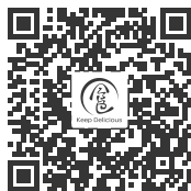
微信扫一扫 获取美食烩食谱

扫描右方二维码，关注“食色FM”公众号，进入电压力锅食谱专题；按照食谱准备好食材放入内锅，按产品上的“美食烩”键，并按手机端食谱指引设置入味时间，按“开始”键即可开始烹饪。