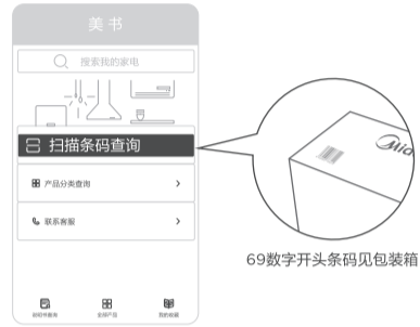
69数字开头条码见包装箱