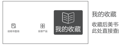
我的收藏 收藏后美书在此处直接查阅