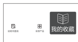
我的收藏 收藏后美书在此处直接查阅